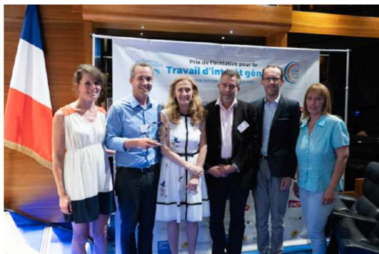
Remise du 1er Prix par Madame Nicole Belloubet, Ministre de la Justice, aux Fermiers de la Francilienne

3 fermes urbaines de 11 salarié·e·s et 200 bénévoles associant pratique écologique, insertion sociale de personnes en difficulté et animation citoyenne et culturelle du territoire en co-construction avec les habitant·e·s.